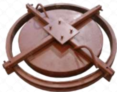
Форма для изготовления опорного кольца (КО-6)

Форма ж/б крышки позволяет ей разместиться в корпусе люка практически заподлицо. Для подъема крышки, в процессе эксплуатации, предусмотрены два технических отверстия или монтаж стационарных рукояток.