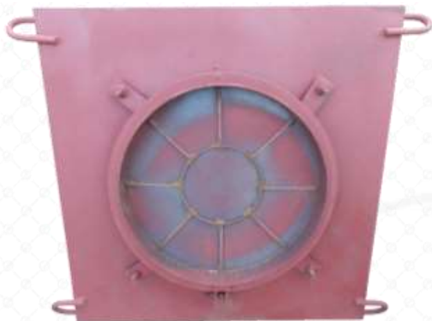
Форма для изготовления крышки люка

Для предотвращения краж чугунных крышек колодезных люков, а так же качественного снижения затрат на данные изделия - крышки и корпуса люка делают из железобетона.