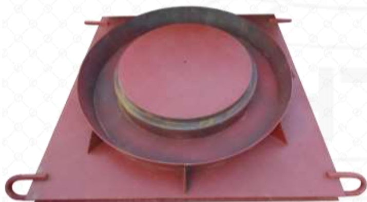
Форма для изготовления корпуса люка

Для их изготовления применяется тяжелый бетон и специальная схема армирования, прочность данного изделия не уступает чугунным аналогам.